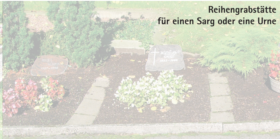
Reihengrabstätte für einen Sarg oder eine Urne

Lage des Grabes vorgegeben Nutzungszeit 30 Jahre keine Verlängerung