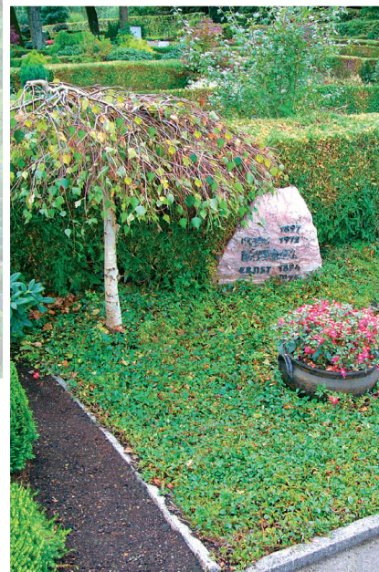
Wahlgrabstätten für zwei Personen Sarg und (oder) Urnenbeisetzungen

Unterhaltung/Pflege durch die Friedhofsträgerin Grabmal durch den Nutzungsberechtigten Nutzungszeit 32 Jahre letzte Verlängerung mit der zweiten Bestattung